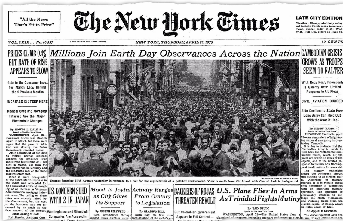
Throng jamming Fifth Avenue yesterday in response to a call for the regeneration of a polluted environment. View is north from 43d Street, with Central Park in background.

Ces problèmes attirent l'attention des Américains dans les années 1960 et on organise des événements tels que la Journée de la Terre :